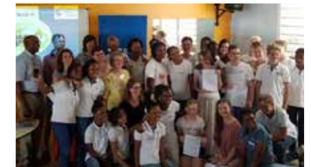
Die teilnehmenden SchülerInnen und Lehrkräfte der Mobilität in Martinique.