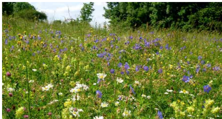
Eine Spezialität des LEV Ostalbkreis ist die Aufwertung von blütenarmem Grünland durch Einsatz von Wiesenblumen gebietsheimischer Herkunft. Bunte Blumenwiesen, wie diese bei Riesbürg-Utzmemmingen, können heute nur noch durch finanzielle Zuschüsse an die Bewirtschafter erhalten werden.

dann mit der Unteren Naturschutzbehörde abgeschlossen werden. Es bestehen derzeit rund 550 solcher Verträge.