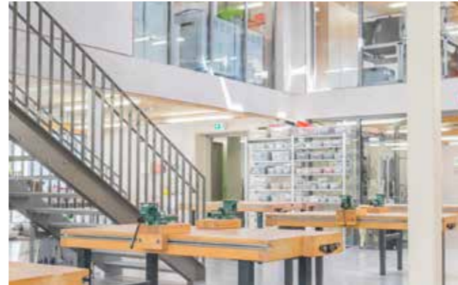
Links // Das INNO-Z an der Hochschule Aalen. Rechts // eule gmünder wissenswerkstatt.

2007 bis 2013 wurden Fördermittel der EU über das Ziel „Regionale Wettbewerbsfähigkeit und Beschäftigung“ (RWB) ausgereicht. Die Schwerpunkte der